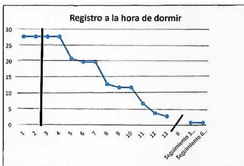
Figura 1. Evolución de la intensidad del miedo a la hora de dormir.

En el seguimiento a los tres y seis meses pudimos comprobar que se mantenían los resultados.